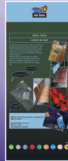
Per promoure una actitud crítica davant les conductes sexuals de risc